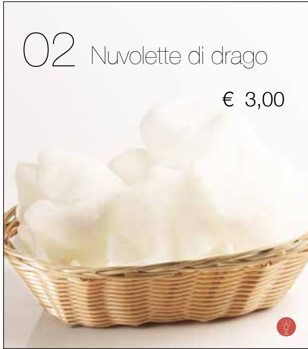
Croccanti chips di farina di gamberi