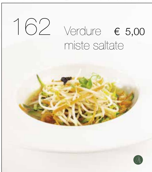
Verdure miste saltate