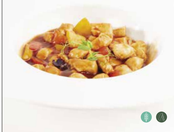
*Pollo saltato con verdure e salsa agrodolce