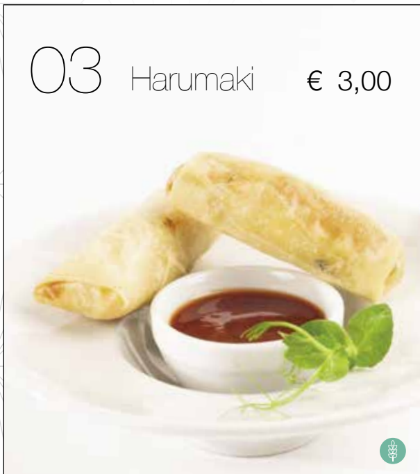
Croccanti involtini farciti con verdure