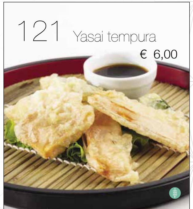
Tempura di verdure miste