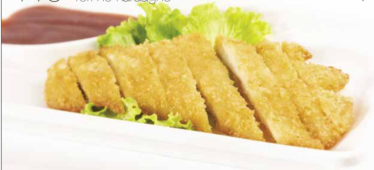
Cotoletta di pollo impanata e frita