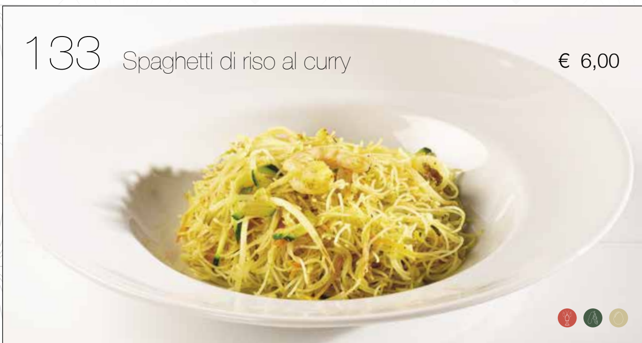
Spaghetti di riso saltati con *gamberi, verdure miste e curry