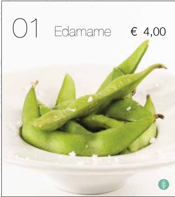
Fagioli novelli di soia