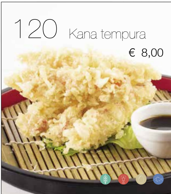
Tempura di *surimi