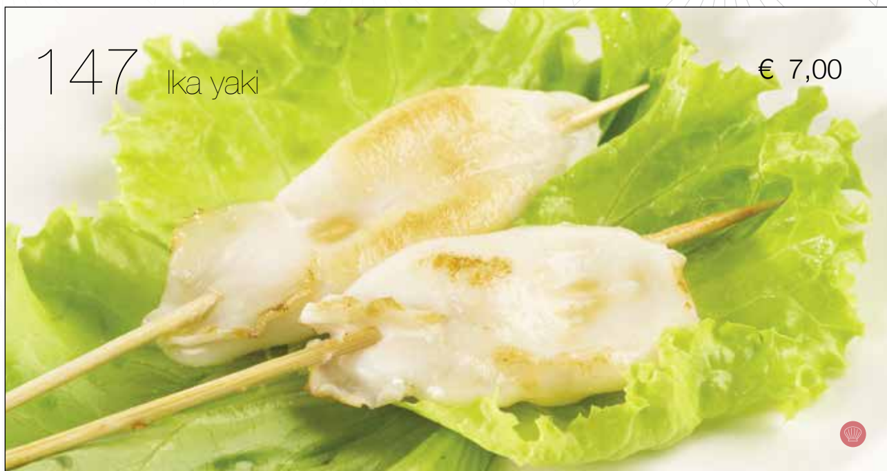
Spiedini di °seppie