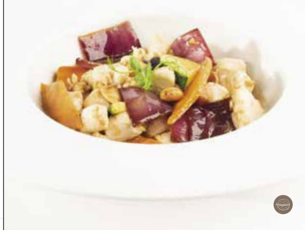
Pollo saltato con verdure e mandorle