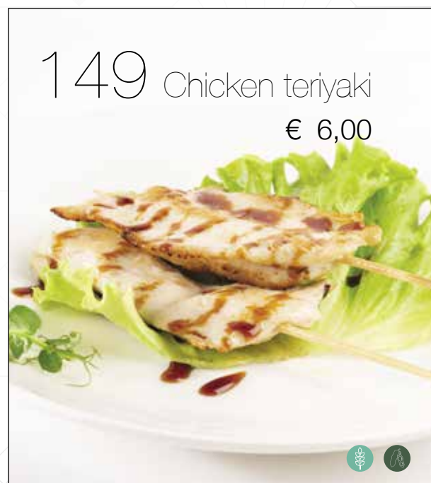
Spiedini di pollo alla piastra con salsa teriyaki