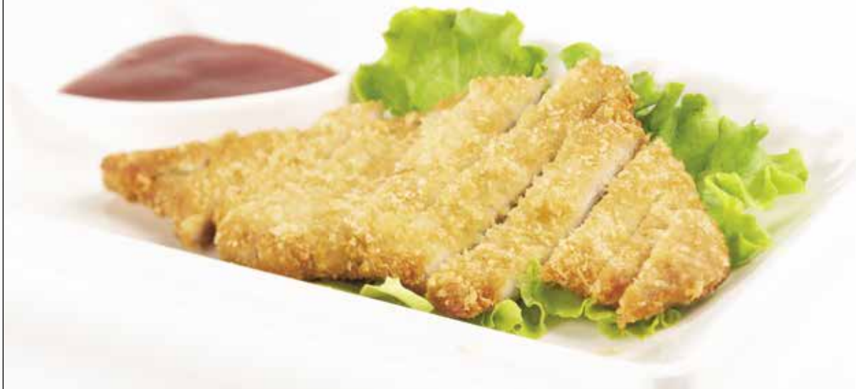
Cotoletta di maiale impanata e frita