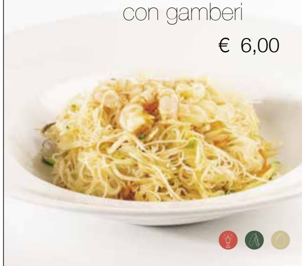
Spaghetti di riso saltati con *gamberi e verdure miste