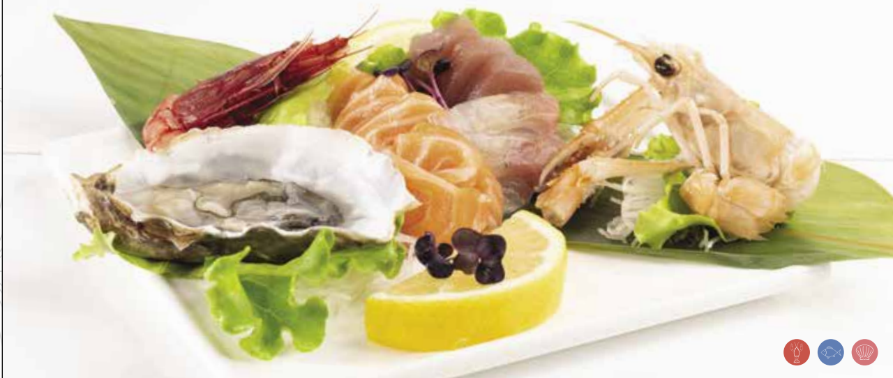
Sashimi misto 1 *gambero rosso, 1 ostrica, 1 *scampo