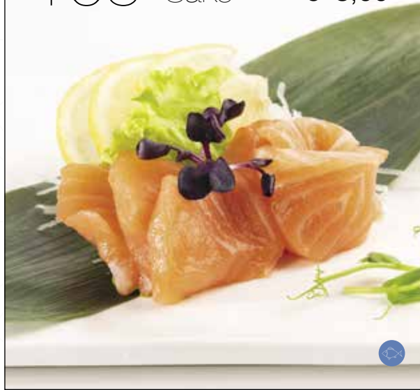
Sashimi di °salmone