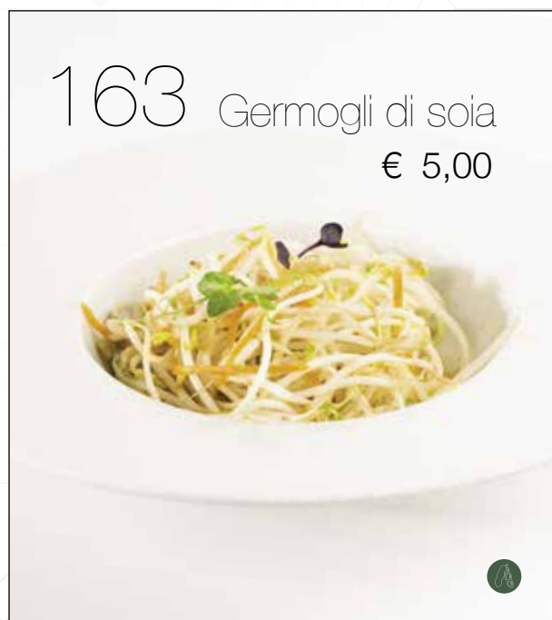
Germogli di soia saltati