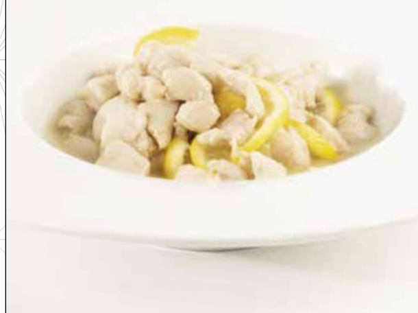
Pollo saltato con salsa al limone