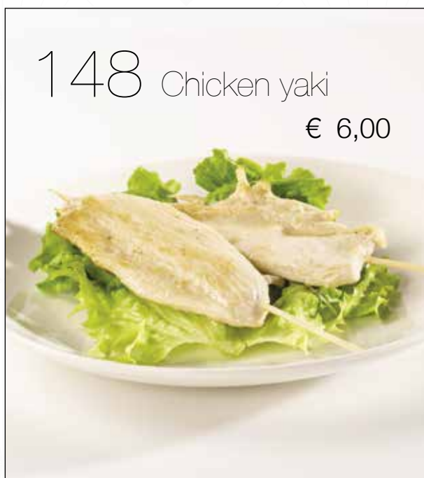
Spiedini di pollo alla piastra