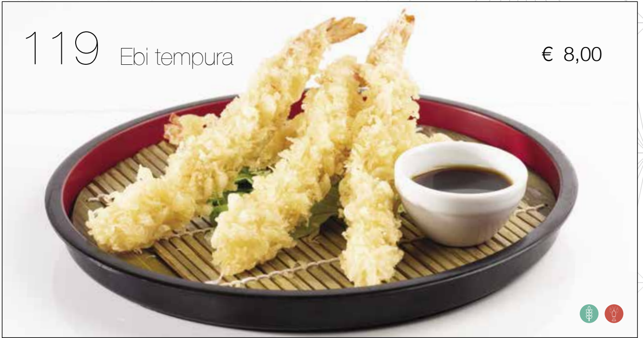
Tempura di *gamberoni