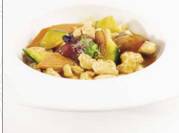
Pollo saltato con verdure e salsa thai