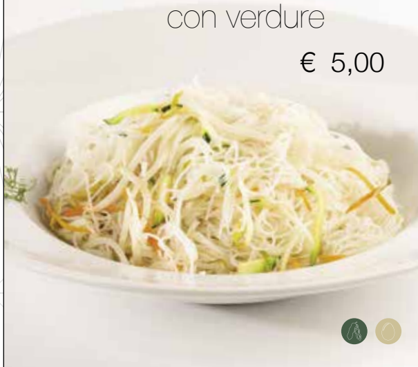
Spaghetti di riso saltati con verdure miste