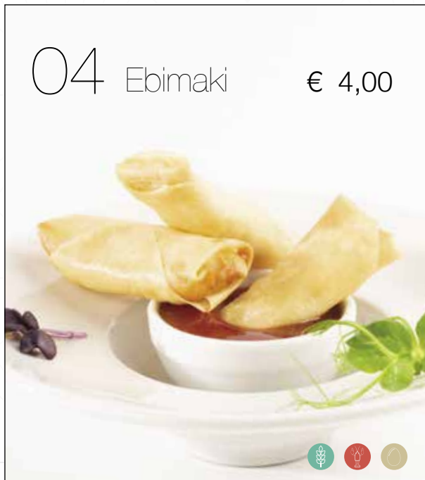
Croccanti involtini farciti con *gamberi